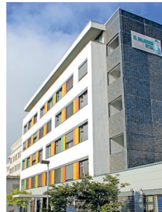
● St. Willibrord-Spital Emmerich